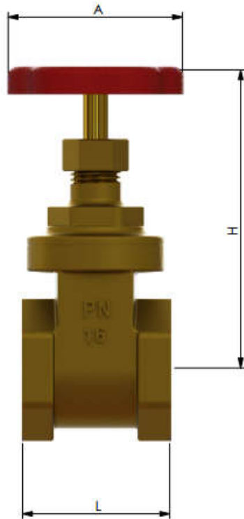
Luistiventtiili, täysaukko, PN 16 Käyttölämpötila Max 80°C Kierteet ISO 228-1